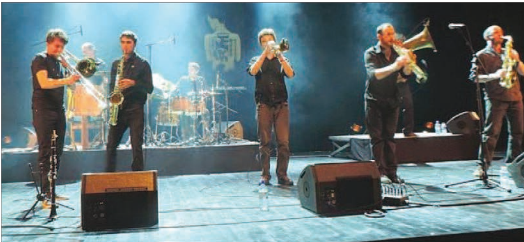
La Fanfare Touzdec au programme de la soirée de l'école de musique, organisée par l'APE, a fait le show.

D ernièrement, La Source a compté plusieurs centaines de spectateurs de tous âges. En effet, l'association des parents d'élèves (APE) de l'école de musique de Fontaine avait offert une soirée musicale, qui, avec cette 3 e édition, devient une tradition appréciée.